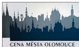
CENA MĚSTA OLOMOUCI

Osobnosti, které se významně zasloužily o propagaci a rozvoj města, budou i letos oceněny prestižní Cenou města Olomouce. Z 38 návrhů vybrali radní osm kandidátů, které ještě musí schválit zastupitelstvo. Vedle herce